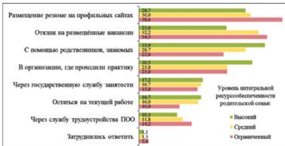
Модели планируемого трудоустройства, по группам интегрального уровня ресурсообеспеченности родительской семьи, %, допускалось несколько ответов Models of planned employment, according to the groups of the integral level of resource availability of the parent family, %, several answers were allowed

60 % студентов из нестоличных городов считают помощь учебного заведения эффективной и способной привести к получению приемлемого рабочего места, то среди обучающихся в региональных столицах с этим согласны только 44 % опрошенных. Одновременно полное отсутствие эффектов от подобной деятельности учебных заведений отмечается среди 18 % респондентов из столиц и 11 % – из менее крупных городов.